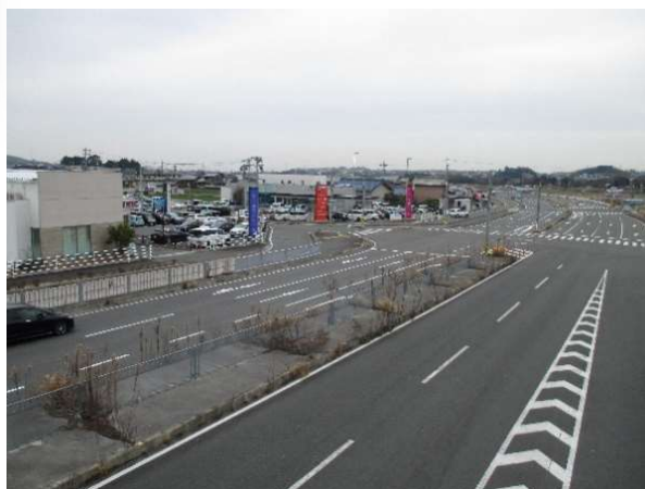
国道 477 号バイパスとメディカルビレッジ