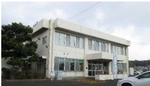
神前地区市民センター