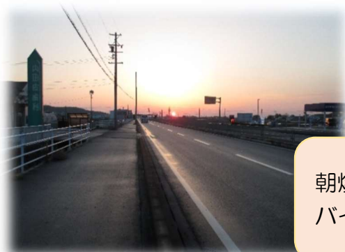
朝焼けの国道 477 号 バイパスと昼間の様子