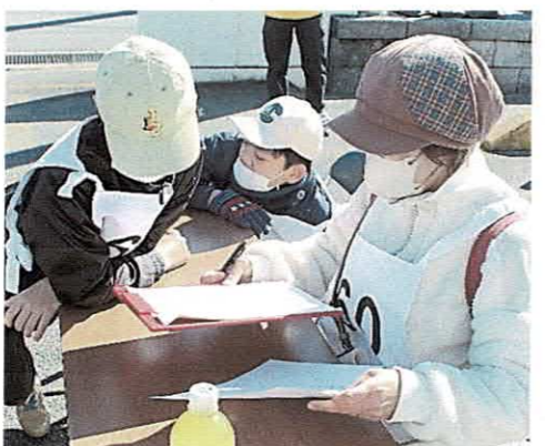
灯笼いくつあった？…6対、2対、3対・・・???