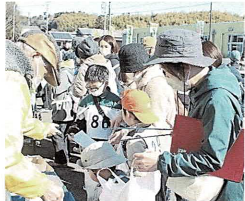
たくさんのゴミを回収しました！