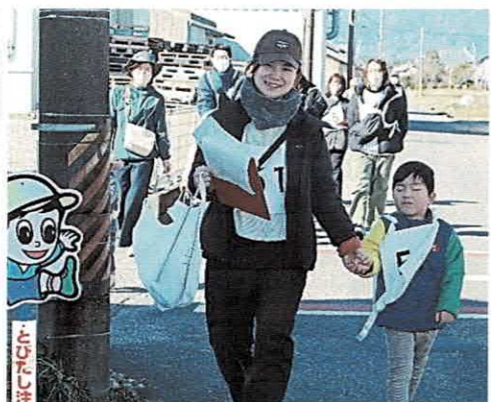
もうすぐゴール！！お疲れ様です～