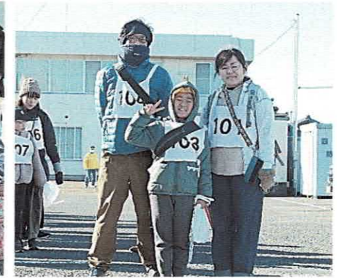
さあ！元気にスタートです。