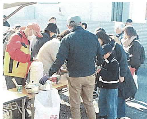
温かいココアでチョット一休み～