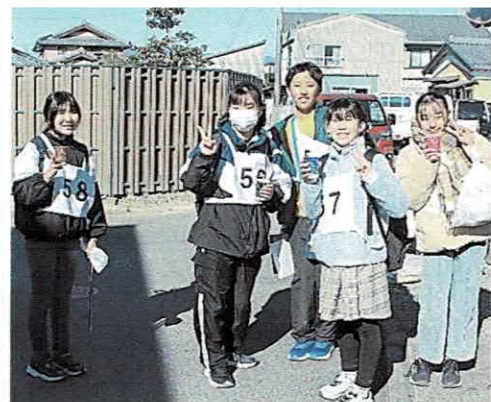
三水会の皆さま 毎回ありがとう