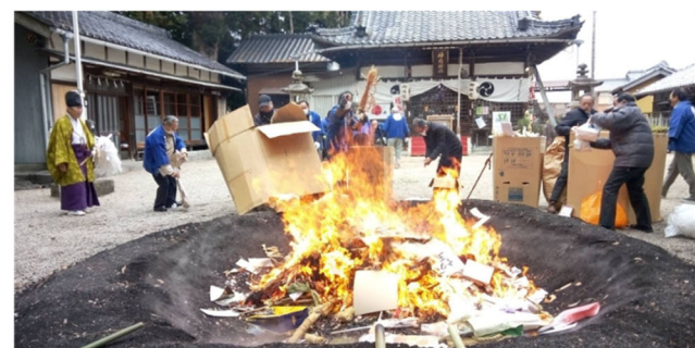
—1/12神前神社のどんど焼き(高角町)—