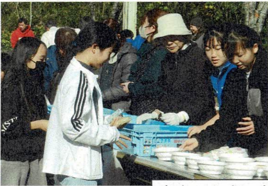
あまーい ほっかほっかの焼き芋だよ