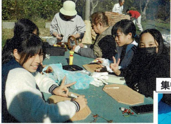
集中してますよー