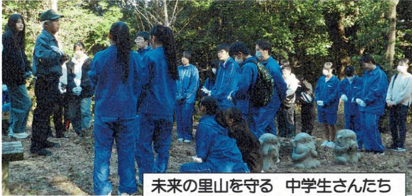
未来の里山を守る 中学生さんたち