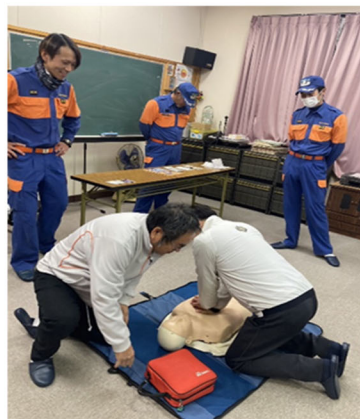
11月の寺方1区講習会の様子 楽しく学びました!!

誰かが倒れていた時、あなたは救命のお手伝いができますか? AEDを使うことができますか?