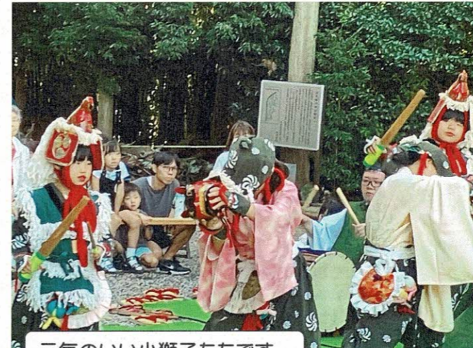
元気のいい小獅子たちです。