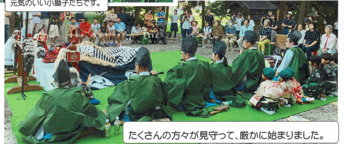
たくさんの方々が見守って、厳かに始まりました。