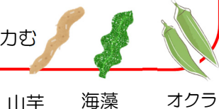
山芋 海藻 オクラ