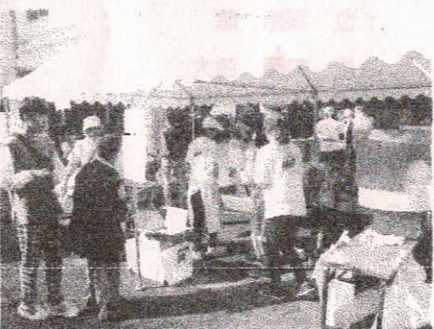
社協青少年部「わた菓子」