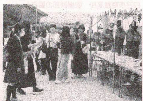
神前消防分団「揚物屋」