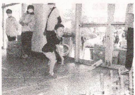
社協福祉部「輪投げ」