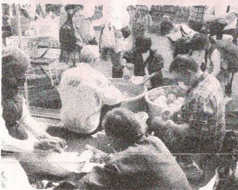
上名ヶ丘「ヨーヨーすくい」