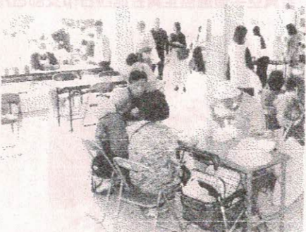
三水会「三水亭うどん」