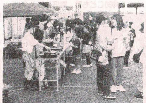
学童保育所「学童茶屋」