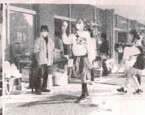
美里ヶ丘「ストライクナイン」