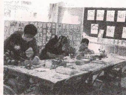
ゆりの会「絵手紙体験」