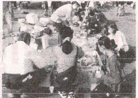
郷土資料館前での「フリーマーケット」