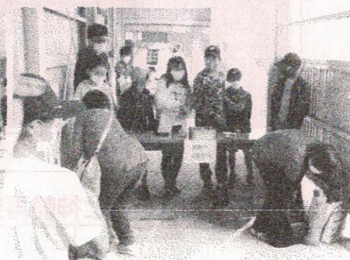
小学校「もち米販売」