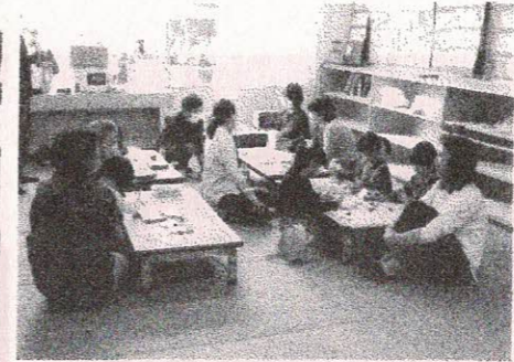
人権コーナー「プラバンづくり」