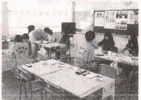
四日市中央工業高校木工部「トレー作り」