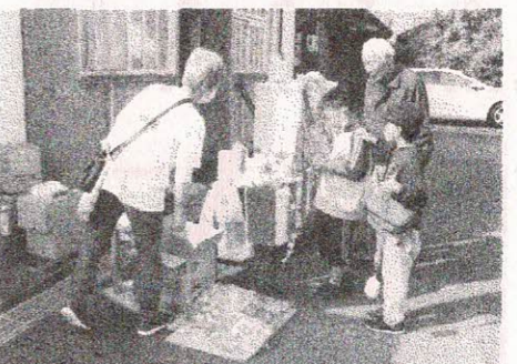
神前郷土資料館の公開