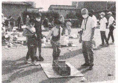
社協保体部「ゲームコーナー」