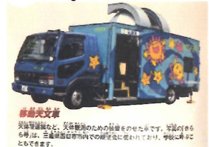
※雨天中止 天候不順など、天候観測のための観望を中止する場合があります。写真は、三島市白旗町内の観望会に使われており、学校に持ちこたれません。