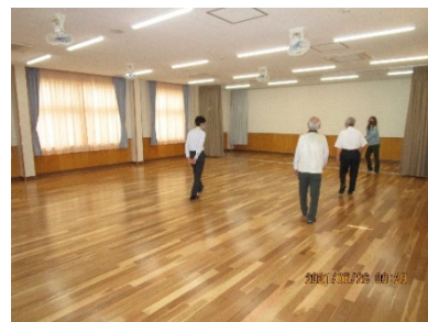
増築した新ホール

今後は、旧幼稚園の園舎を解体し、大きな運動場にする工事が始まります。完成すれば、神前地区の幼児保育・教育の中心になると思います。竣工は令和4年の4月を予定しています。待ち遠しいですね。