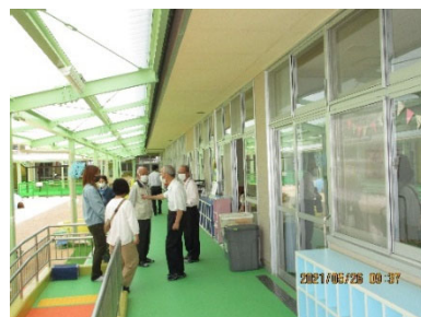
子育て支援センター前廊下

各部屋がコの字に配置され、回廊ですべてつながっています。また、職員室が一番南に新築されたことで、園庭で遊ぶ子どもたちの様子をすべての職員が見守れるようになっています。トイレが多く作られ、廊下もすべてバリアフリーになっています。